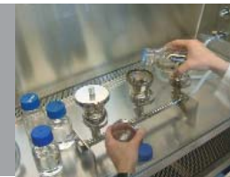
Mikrobiologische Analyse in unserem akkreditierten Labor